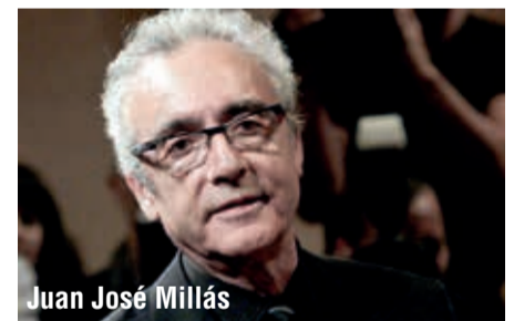
Juan José Millás

Y especialmente para Fernando Colomo, primer candidato al Senado por Madrid.