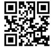
PARA LEER EL MANIFIESTO COMPLETO

Busca estas papeletas en tu colegio electoral