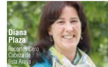
Diana Plaza Recortes Cero Cabeza de lista Arava