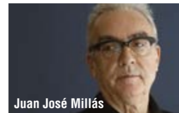
Juan José Millás