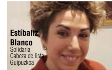
Estibalez Blanco Solidaria Cabeza de lista Guipuzkoa