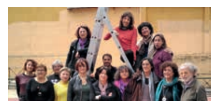
Manifiesto publicado por Recortes Cero en la campaña de las generales del 28-A en El Periódico de Catalunya