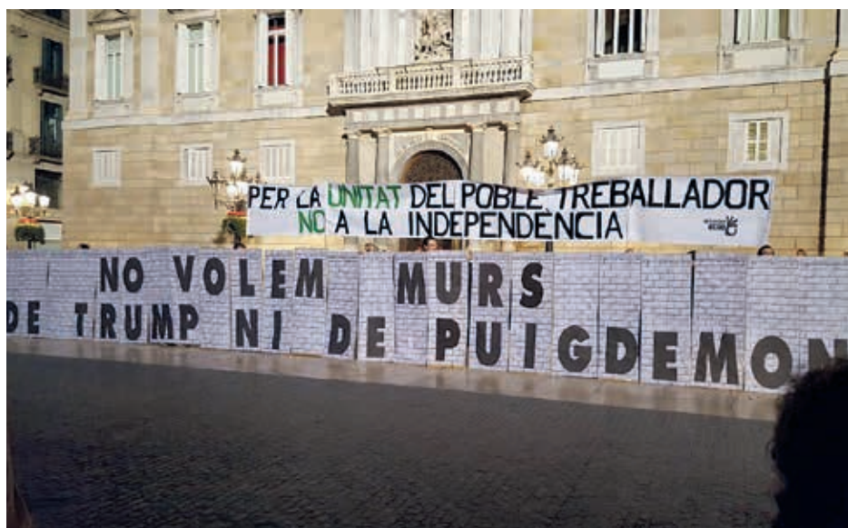
Concentración de Recortes Cero en la Plaça Sant Jaume de Barcelona