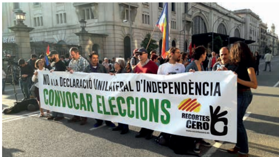
Concentración de Recortes Cero ante el parlament catalán el día de la aprobación de la DUI.