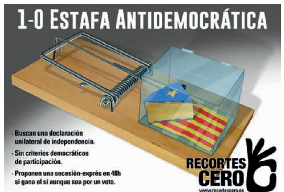
Cartel de la campaña de Recortes Cero frente a la celebración del referéndum del 1-O

Cualquier proyecto de progreso, todas las conquistas de derechos, se han basado en fortalecer la unidad del conjunto del pueblo español, en una lucha común.