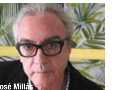
Juan José Millás