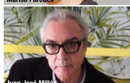
Juan José Millás