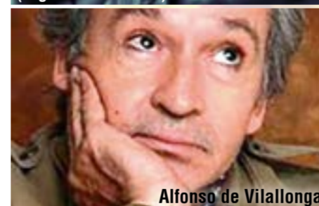
Alfonso de Vilallonga