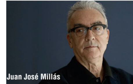
Juan José Millás

PRIMER MANIFIESTO DE APOYO. La ley electoral nos exige recoger firmas. ¡Y VAMOS A RECOGER 60.000 EN TODA ESPAÑA!